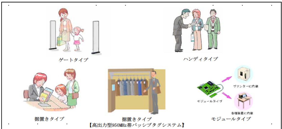
図4 各タイプのRFID機器