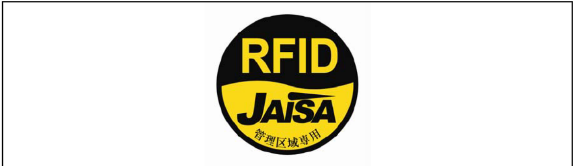
図3 管理区域専用RFID機器用ステッカー

注1：ここでは、公共施設や商業区域などの一般環境下で使用されるRFID機器を対象としており、工場内など一般人が入ることができない管理区域でのみ使用されるRFID機器（管理区域専用RFID機器）については対象外としている。なお、管理区域専用RFID機器については、（社）日本自動認識システム協会において、一般環境への流出を防止するため、取扱説明書等に注意書きを記載するとともに、管理区域専用RFID機器用ステッカー（図3）を貼付することとされている。