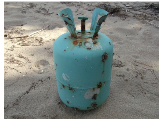
写真3 ガスボンベ【高圧ガス】