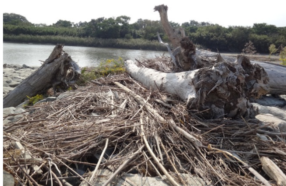
写真2 河川敷にある流木の事例