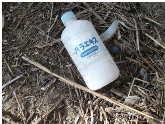
写真5 農薬容器【薬品類】