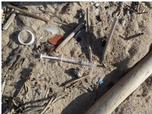
写真1 注射器【医療系廃棄物】