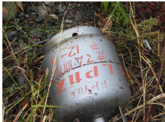
写真1 危険物が放置されている事例