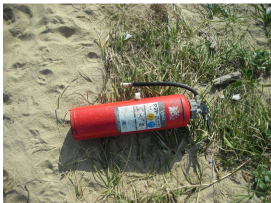
写真4 消火器【高圧ガス】