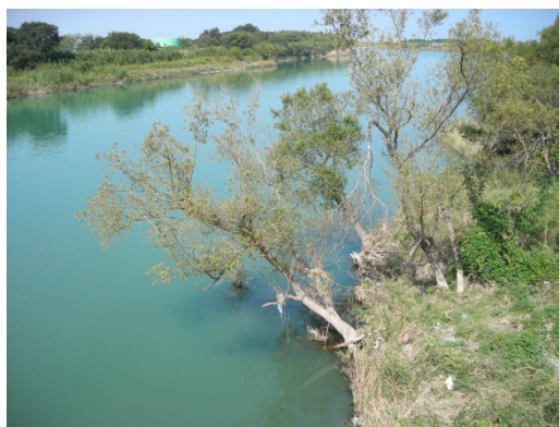
写真3 流出しそうな樹木の事例