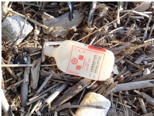
写真2 薬品容器【医療系廃棄物】