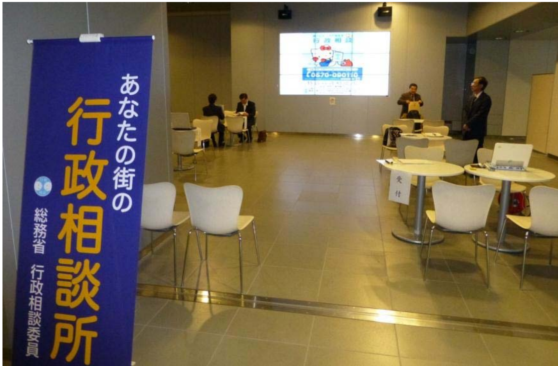
【特設行政相談所の様子】