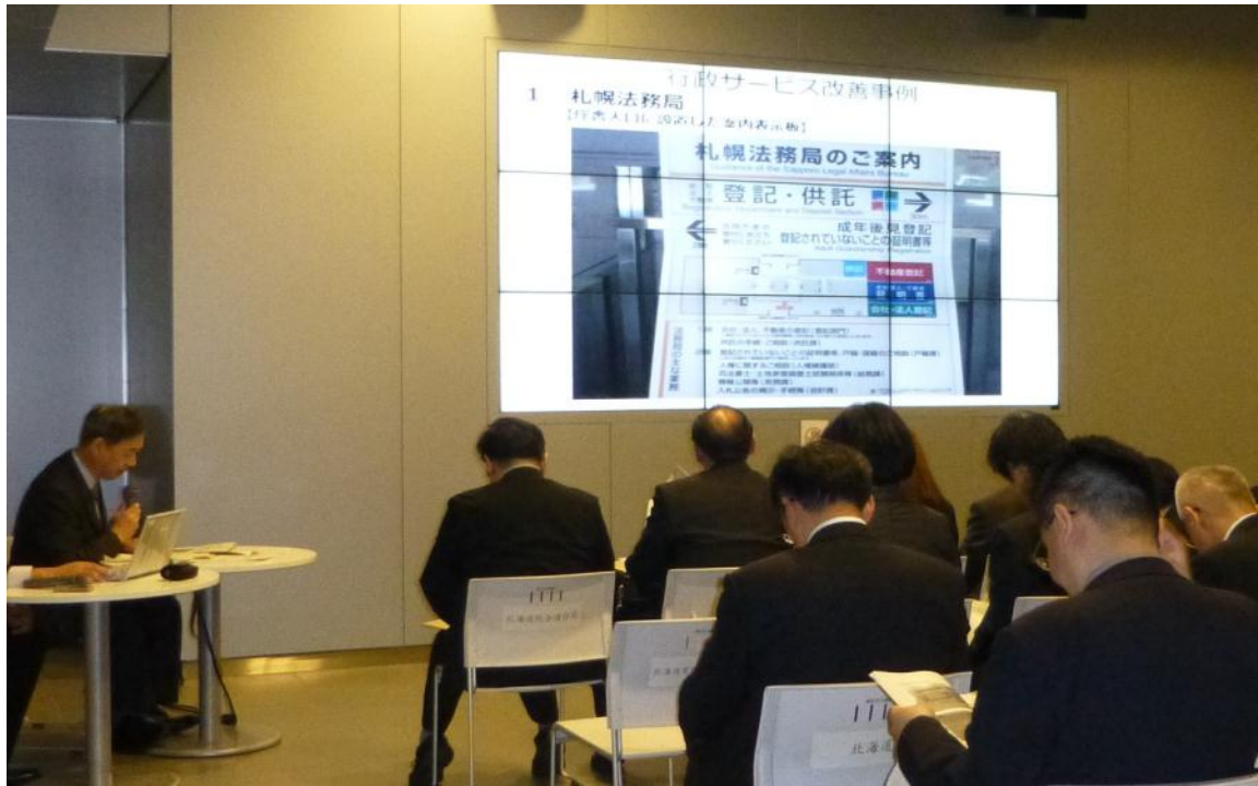
【北海道管区行政評価局による「各機関における行政サービス改善事例」の発表の様子】