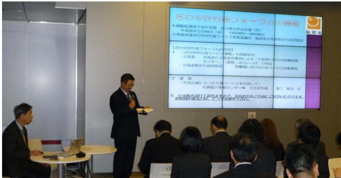
【冒頭のあいさつの様子】