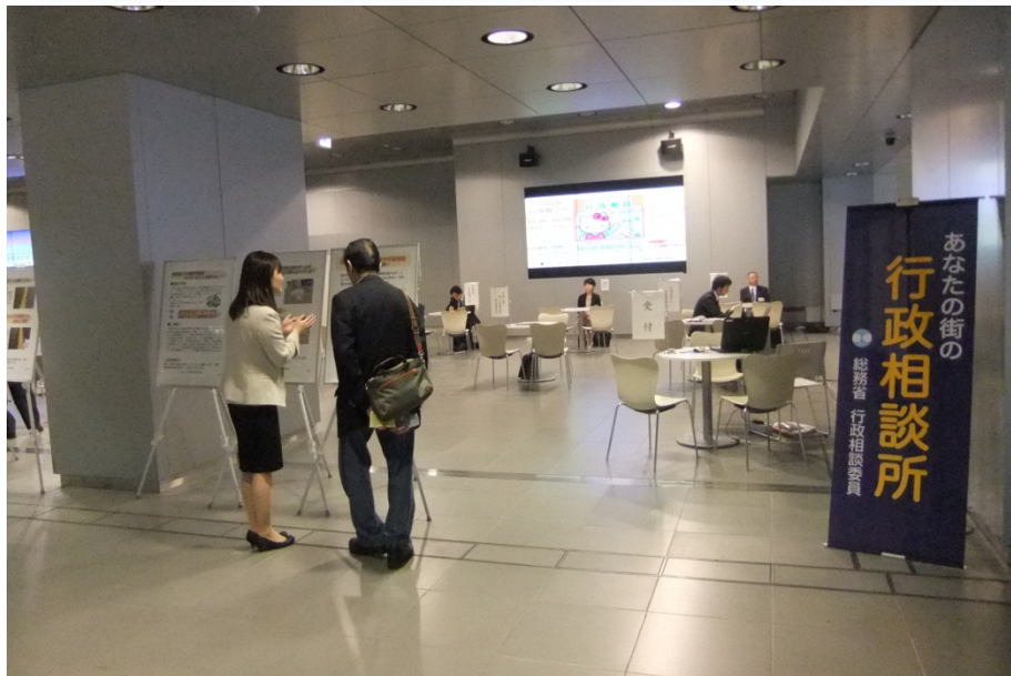
【特設合同行政相談所の様子】