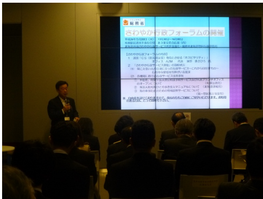
【冒頭のあいさつの様子】