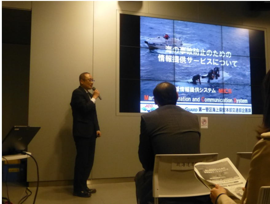
【各機関による行政サービス改善事例発表の様子】