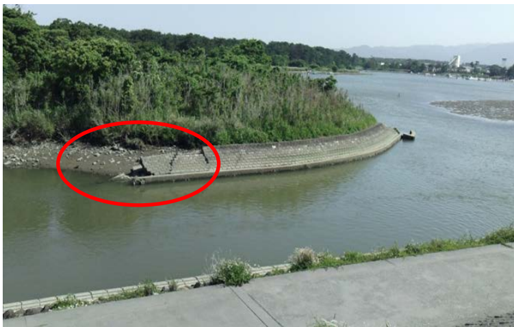
【八重川・八重川護岸】