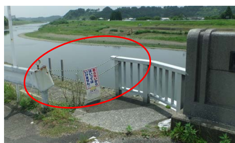
【大淀川・大の丸橋付近】