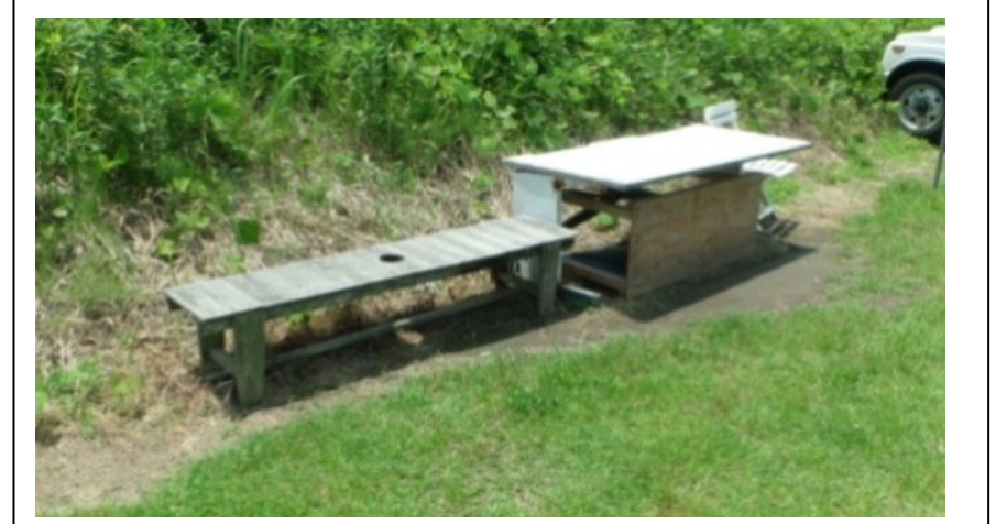
(宮崎県：大淀川) ※平成 26 年 6 月末撤去済み