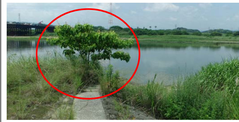
【大淀川・竹原田樋門】