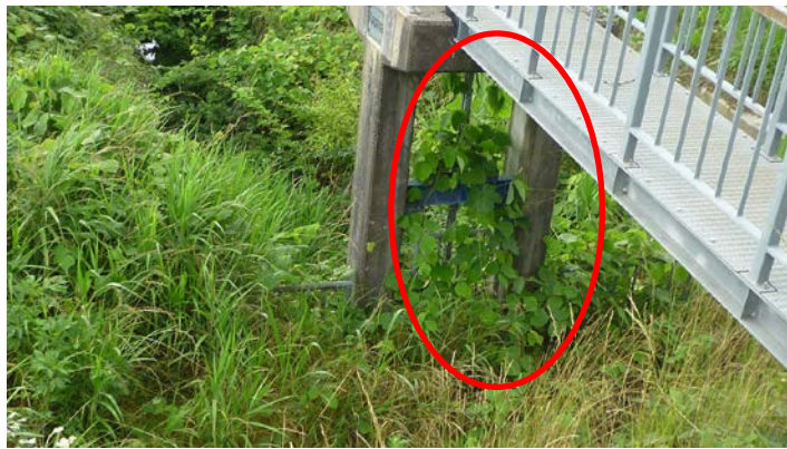
【大淀川・太郎丸排水樋管】