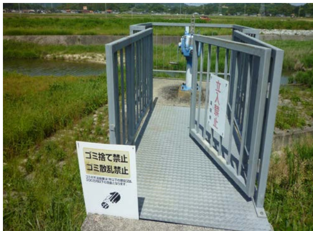
【遠賀川・チシャノ木用水樋管】