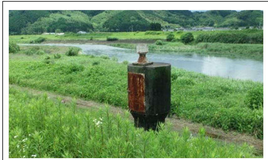
【彦山川・番田樋管】