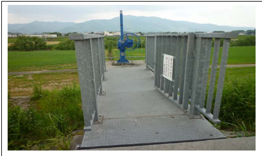
【彦山川・下境樋管】