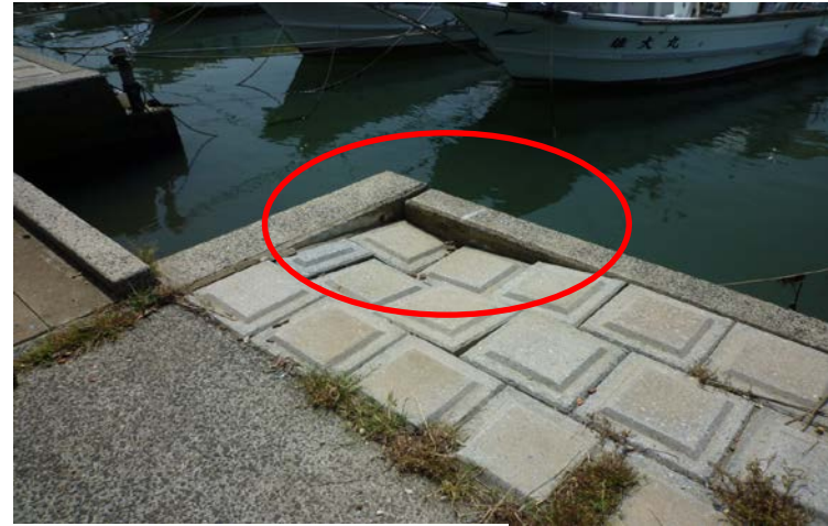
【西川・護岸（島津排水樋管付近）】