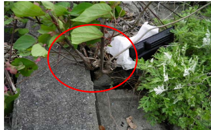
【彦山川・護岸（成道寺樋門付近）】