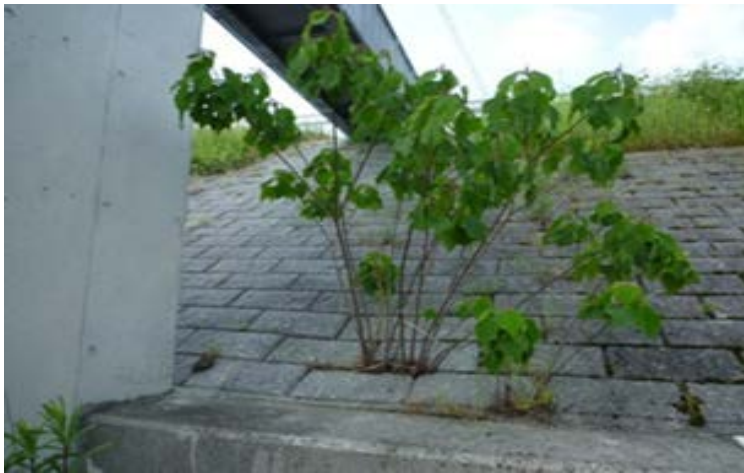
【彦山川・護岸（経塚第3排水樋管付近）】