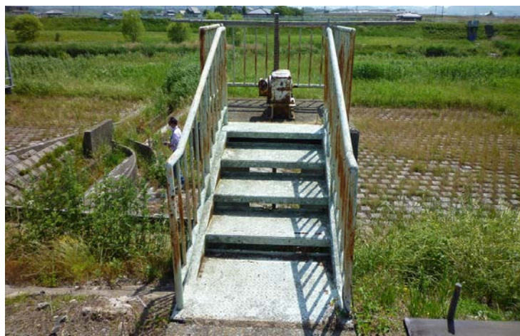
【笹尾川・高江第一号用水樋管】