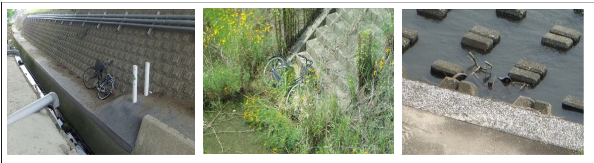
(宮崎県：大淀川、八重川)