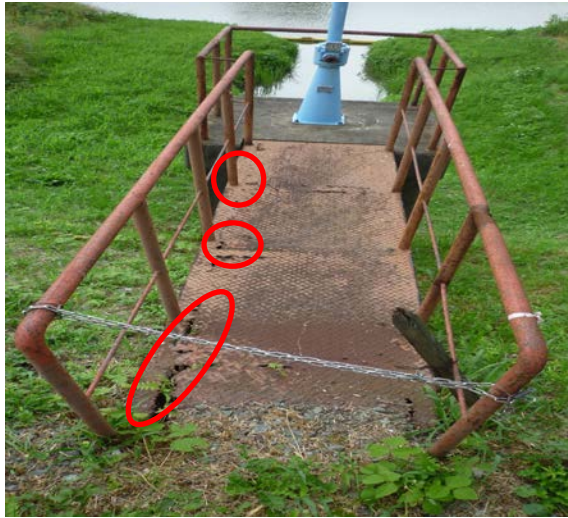
【穂波川・萩原上水道樋管】