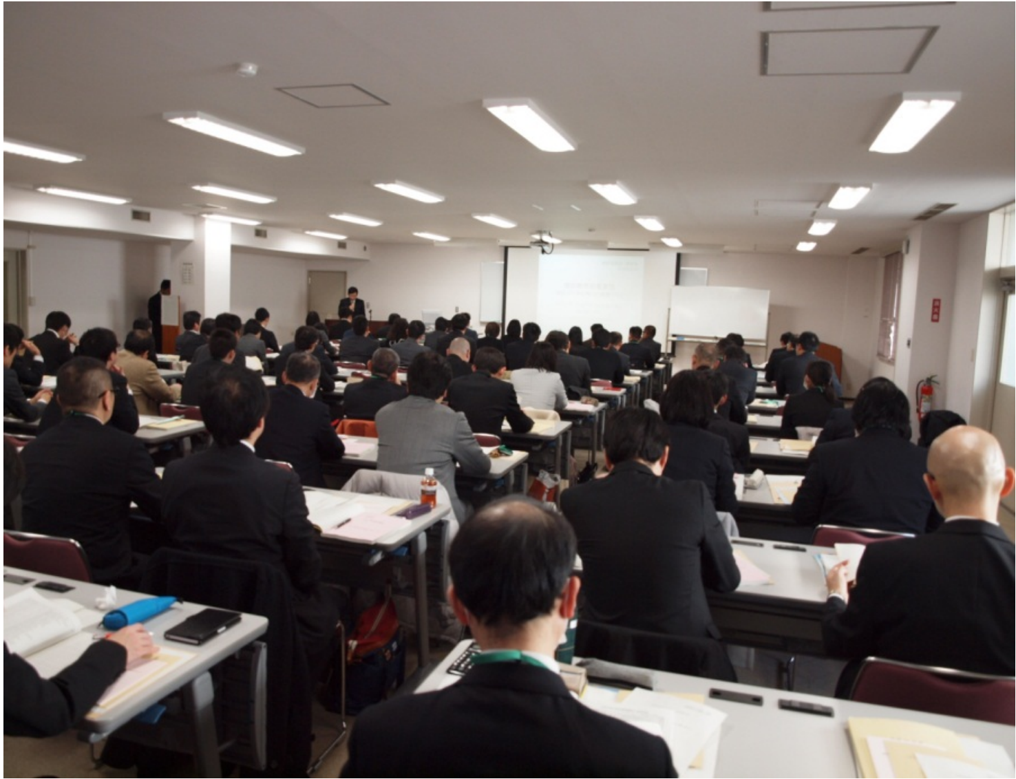
統計指導者講習会