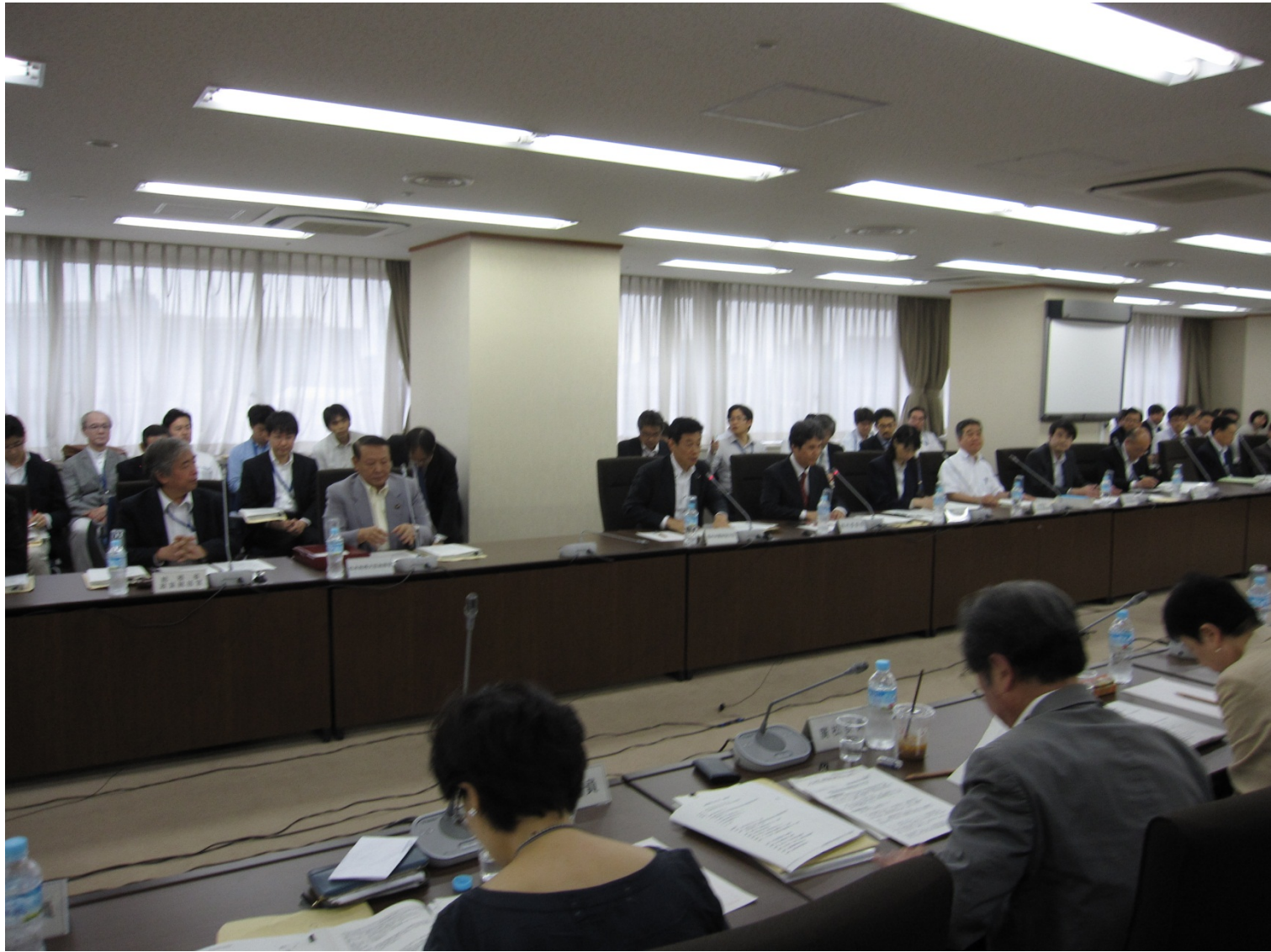
統計委員会での審議の様子