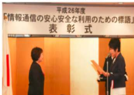
標語プロモーション (平成26年度の例)