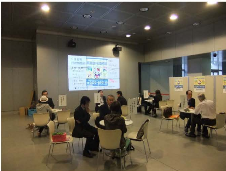
【特設合同行政相談所の様子】