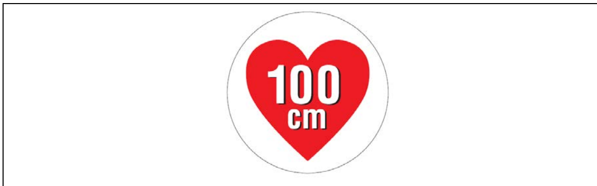
図2 据置きタイプRFID機器（高出力型950MHz帯パッシブタグシステム）用ステッカ

注1： ここでは、公共施設や商業区域などの一般環境下で使用されるRFID機器を対象としており、工場内など一般人が入ることができない管理区域でのみ使用されるRFID機器（管理区域専用RFID機器）については対象外としている。なお、管理区域専用RFID機器については、（一社）日本自動認識システム協会において、一般環境への流出を防止するため、取扱説明書等に注意書きを記載するとともに、管理区域専用RFID機器用ステッカ（図3）を貼付することとされている。