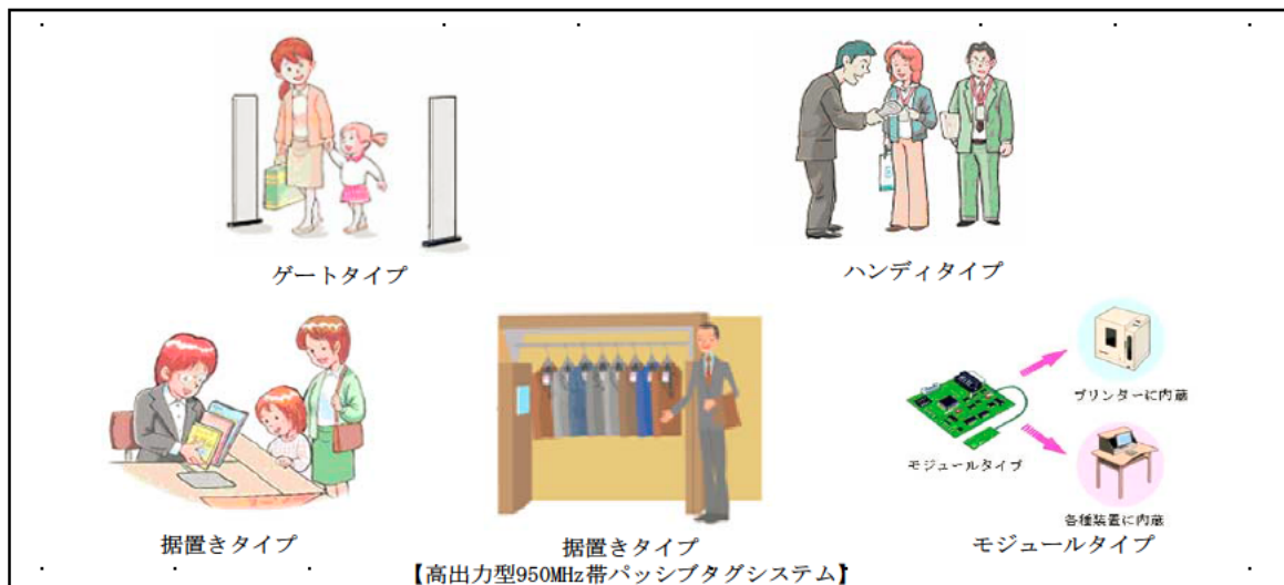
図4 各タイプのRFID機器

注3： 比較的長距離の通信が可能なUHF帯（950MHz帯）の電波を利用するRFID機器。 例えば、コンテナやパレットなどに貼付したタグの一括読み取り等のアプリケーションに使用されることが想定される。