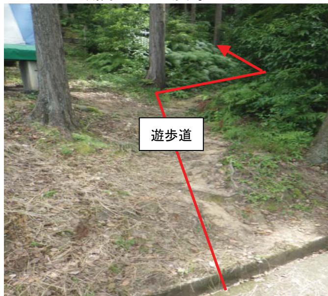
⑦ー i 誘導標識がなく分かりにくい遊歩道の入口 (近江湖南アルプス(奥島地区))