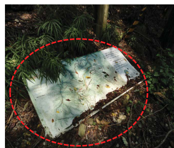
⑨ー i 木枠から外れている案内標識(明治の森箕面)