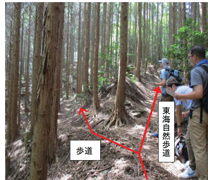
⑦ー ii 誘導標識がなく分かりにくい分岐点(明治の森箕面)