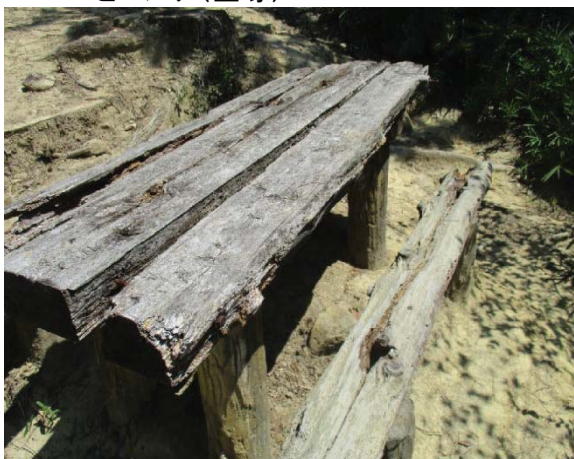
⑤-i 老朽化し破損したままのテーブルとベンチ(宝塚)