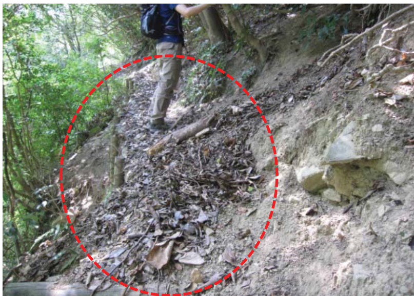
③-iii 土砂に覆われた遊歩道(紀泉高原)