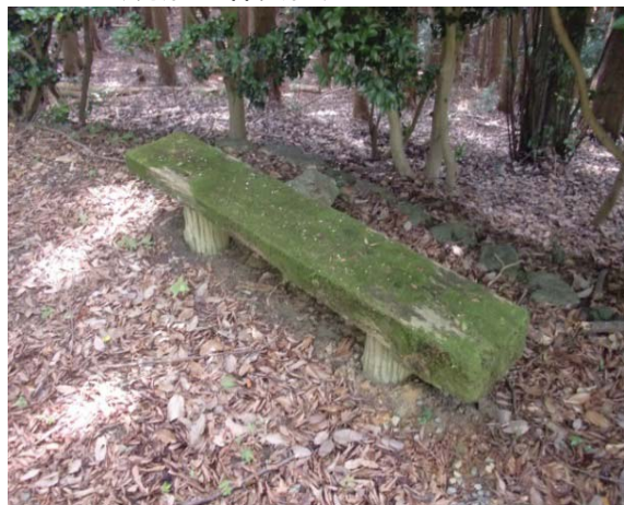
⑤-ii 老朽化しコケが覆ったベンチ(明治の森箕面)