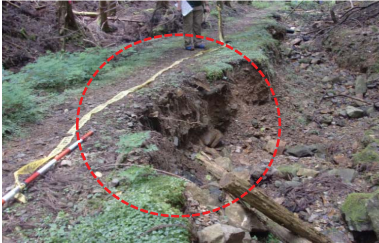
① 遊歩道の崩壊した路肩(明治の森箕面)