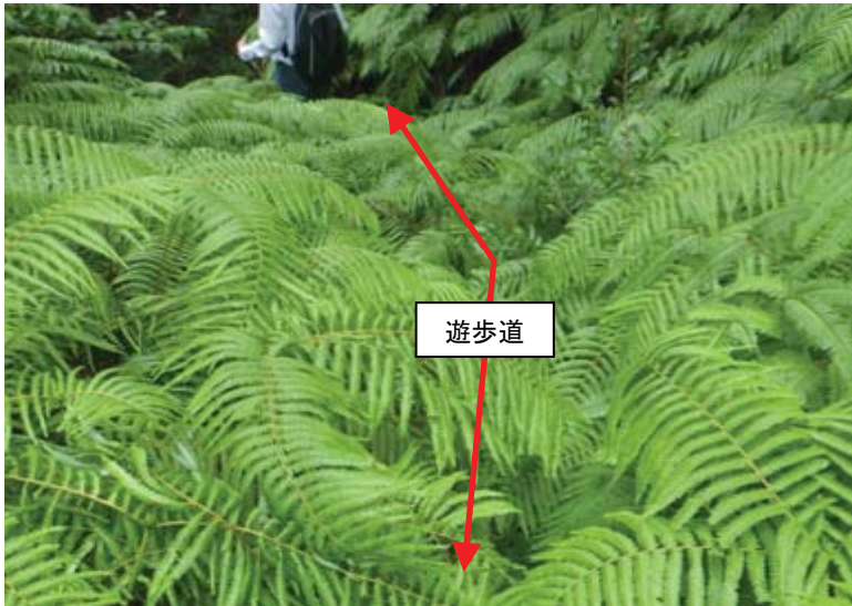
③ - i 繁茂したシダ等に覆われた遊歩道 (近江湖南アルプス(奥島地区) ※奥島スカイ3号線)