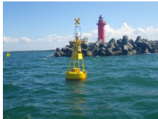
灯浮標(工事区域明示用)