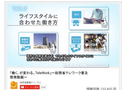
テレワーク普及啓発動画