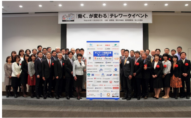
お披露目式（2016年11月28日）