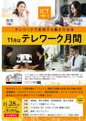
ポスターイメージ