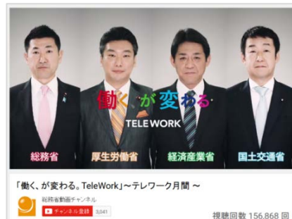
テレワーク月間 PR 動画