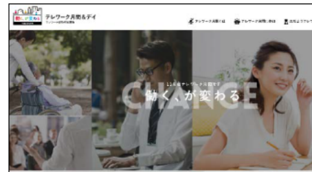
テレワーク月間サイト （テレワーク月間に向け10月にリニューアル）