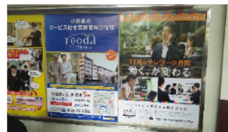
小田急電鉄（小田急相模原駅）