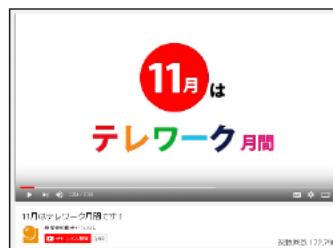
PR動画インターネット配信