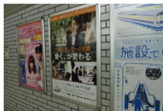
都営地下鉄（東銀座駅）