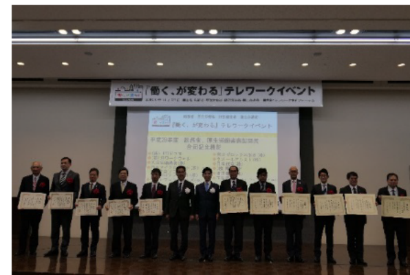
『働く、が変わる』テレワークイベント (総務省・厚生労働省 大臣賞表彰式)