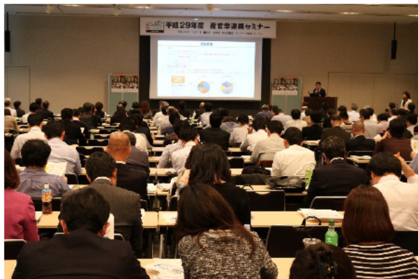
テレワーク推進フォーラム 産官学連携セミナー