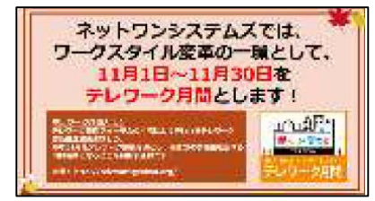
社内デジタルサイネージ (ネットワンシステムズ)