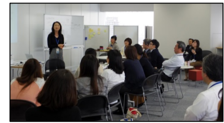
「今後の働き方について語り合う会」 (リコーITソリューションズ)