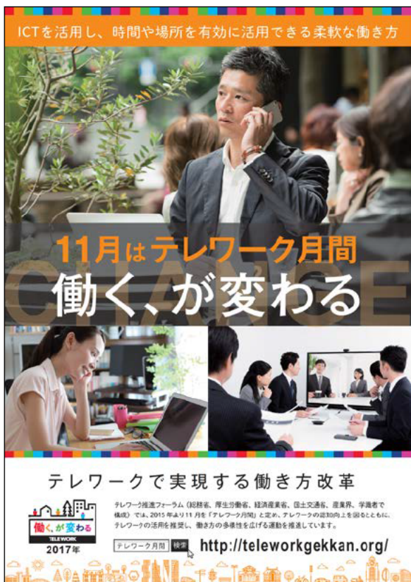
テレワーク月間周知ポスター