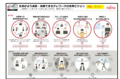
テレワークの活用シーンやメリットを周知するポスター (富士通)