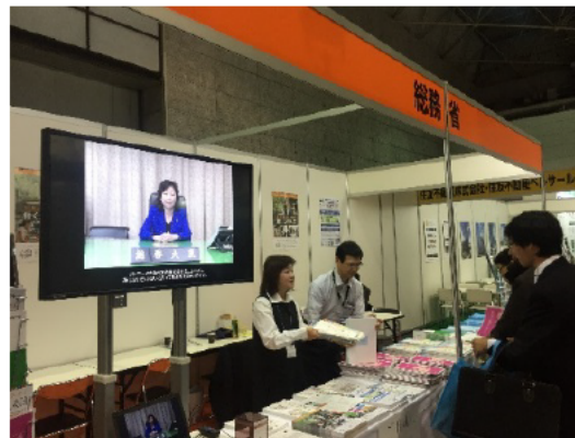
関西ワークスタイル変革EXPO 総務省ブース出展