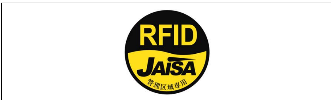
図2-3 管理区域専用RFID機器用ステッカ

注1：ここでは、公共施設や商業区域などの一般環境下で使用されるRFID機器を対象としており、工場内など一般人が入ることができない管理区域でのみ使用されるRFID機器（管理区域専用RFID機器）については対象外としている。なお、管理区域専用RFID機器については、（一社）日本自動認識システム協会において、一般環境への流出を防止するため、取扱説明書等に注意書きを記載するとともに、管理区域専用RFID機器用ステッカ（図2-3）を貼付することとされている。