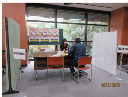
戸田一日合同行政相談所