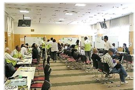
（一日合同行政相談所）

このほか、平成30年度は、埼玉県内（東松山市10/16、さいたま市 10/18、上尾市 10/29）において、国民の皆さまからさまざまなご相談をワンストップで受け付ける「一日合同行政相談所」を、国の行政機関、地方公共団体などと合同で開設します。