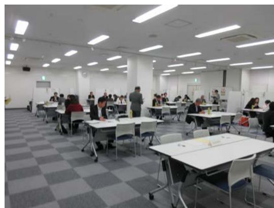
鴻巣一日合同行政相談所