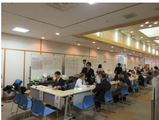
さいたま一日合同行政相談所