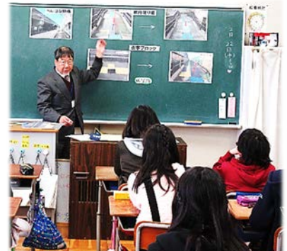
（行政相談出前教室）