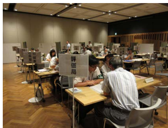
川越一日合同行政相談所

一日合同行政相談所は、平成30年10月16日（火）東松山市、18日（木）さいたま市、29日（月）上尾市で開設します。