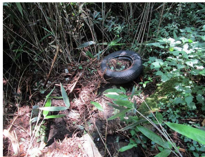
不法投棄とみられる古タイヤが放置 (改善済み)【芦ノ湖風景林】