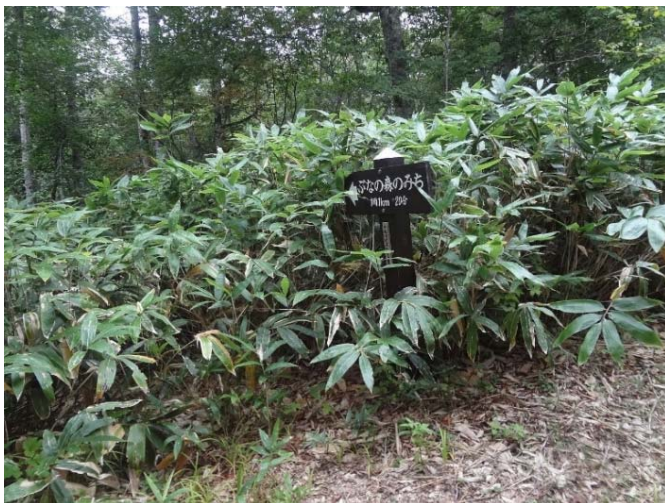
笹が繁茂し入口が判別できない遊歩道 (改善済み) 【武尊自然休養林】