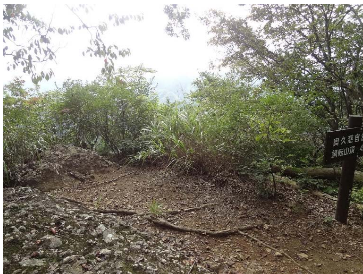
草や樹木が繁茂して展望のない展望台 【奥久慈自然休養林】