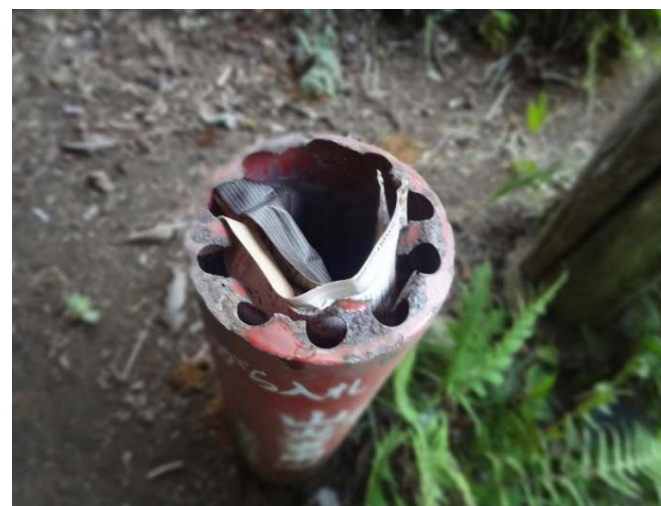
紙くずが詰め込まれた吸い殻入れ 【奥久慈自然休養林】