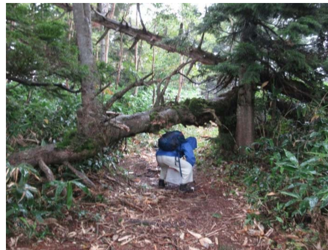
歩道上に横たわる倒木 【野反自然休養林】