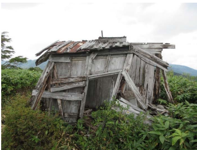
倒壊寸前となった木造の小屋 【野反自然休養林】