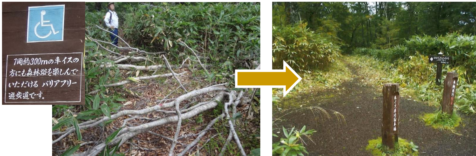
倒木や笹の繁茂により車いすの通行ができないバリアフリー歩道(改善済み)【武尊自然休養林】