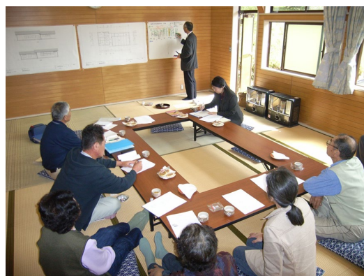
高野町 集落再生会議