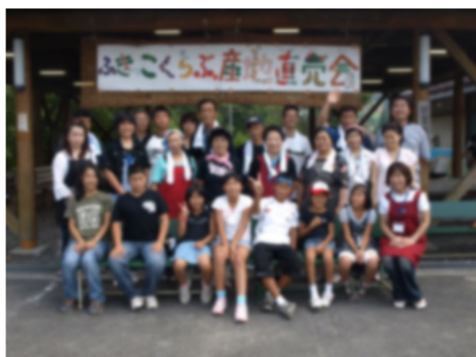
高野町 産直市の打ち上げ

宮城県川崎町において地域の特産品の蕎麦に着目し、高校生のクラブ活動の一環として若い世代に蕎麦をアピールするためのレシピを考案することで、地域活性化に結びつける取り組みを専門家として支援した。蕎麦店経営者、野菜農家、養豚農家を取材し、様々な料理を試行錯誤しながら試食会を開催。時節柄、オンラインによる交流支援を取り入れながらの実施を工夫した。