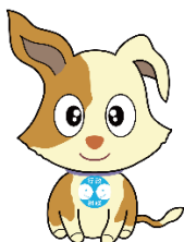
（行政相談マスコット キクーン）