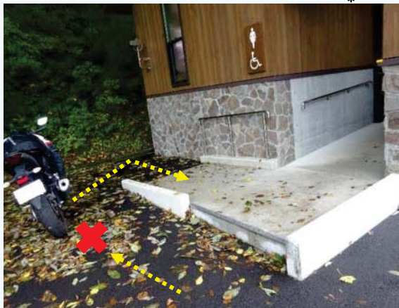
トイレ入口のスロープ前にバイクが駐車され、車いすでの利用を妨げている

【事例1】 駐車場に車いす使用者用駐車スペースが確保されていない（駐車場を整備している27事業*で17事例）