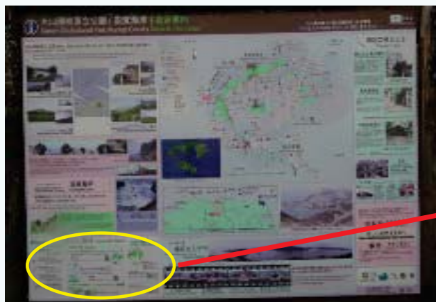
【事例3】QRコードを携帯電話で読み込んでもリンク先が削除(1事例)