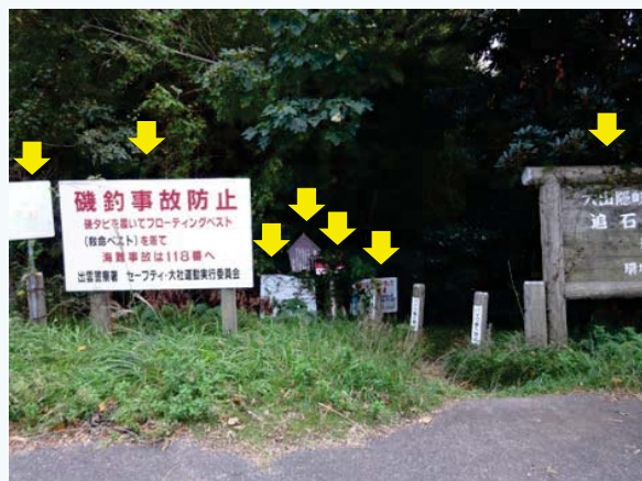
【事例1】乱立している(1事例)