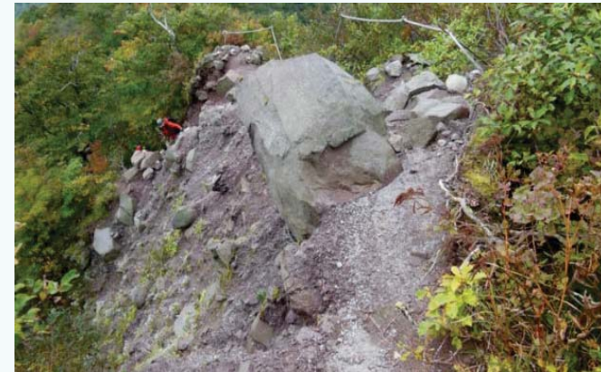
「ユートピアコース」の崩落箇所

【事例2】 大山の上級者ルート「ユートピアコース」には崩落箇所があるが、このコースには管理者がなく、未修復のまま。(1事例)