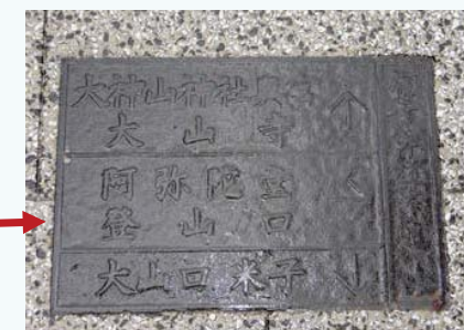
路面にはめこんであり気づきにくい