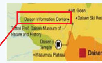
Daisen Information Center Daisen-Oki National Park Map から抜粋