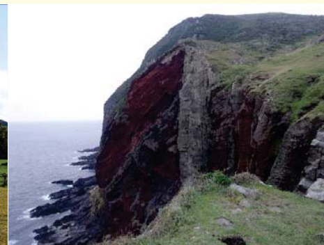
赤壁(島根県:隠岐島地域)