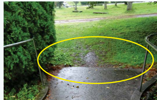
スロープ前が未舗装。雨の日はぬかるんで車いすで通行しにくい