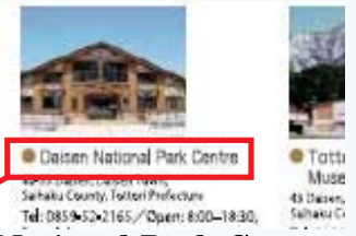
Daisen National Park Centre Daisen-Oki National Park Leaflet から抜粋