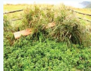
雑草が繁茂しベンチに座れない