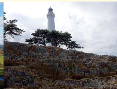
日御碕(島根県:島根半島地域)