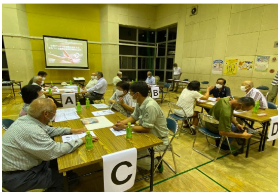
データによるワガコト化 & 住民同士の対話

住民が実感できる規模・単位で、人口減少・少子高齢化の現状と将来見通しを具体的なデータを用いて解説しつつ、中学生以上の全住民を対象にした地区住民アンケートの実施を促し、思い込みではなく、客観的なデータに基づいて、地域づくりの「次の一手」を、住民自らが考え、決断し、実行していただくための支援を行っています。