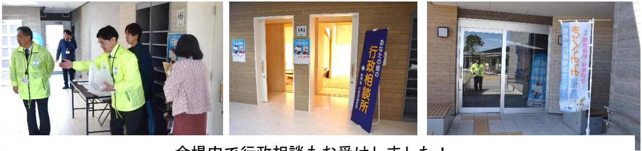
会場内で行政相談もお受けしました！