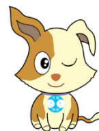
【行政相談マスコット】 キクーン