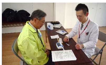
（唾液でストレスもチェック！）