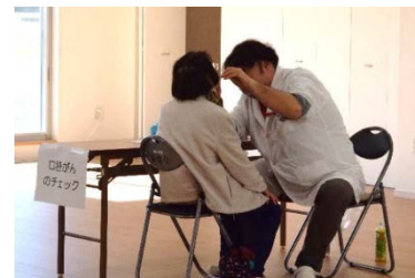
（口腔がんのチェック中！）