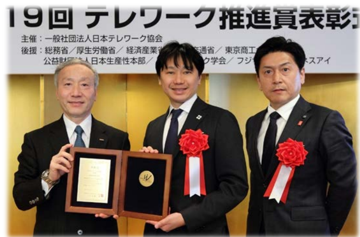
「第19回テレワーク推進賞」の会長賞を受賞(2019/2/21に表彰式)

第1回教育現場におけるクラウド活用の推進に関する有識者会合西条市発表資料より ※「1年目」:平成25年度末