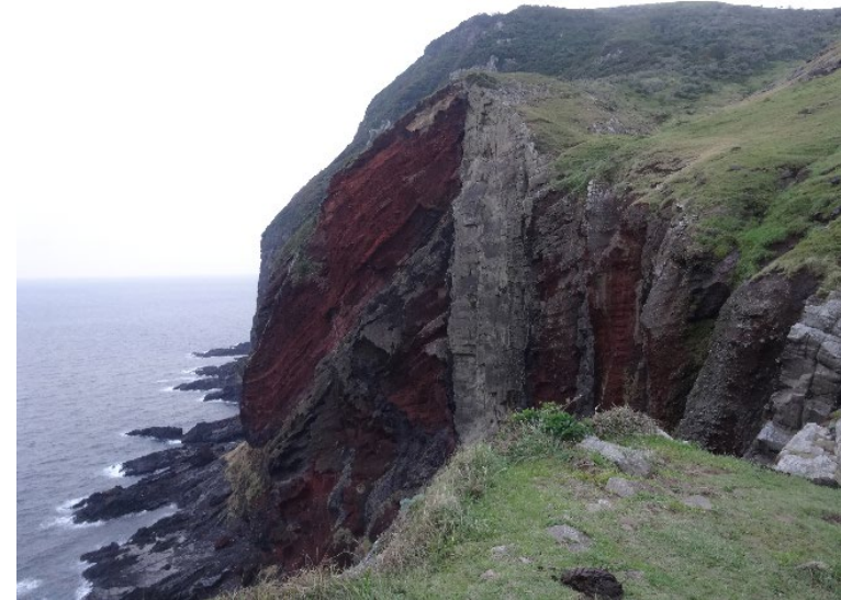
（島根県隠岐・赤壁）