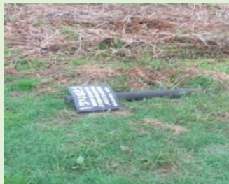
図表③ 公共標識の不具合の是正