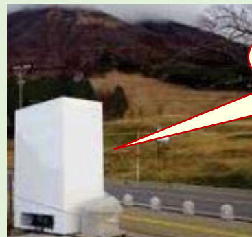
図表② 許可基準に適合しない工作物を撤去

池の周囲に設置された進入防止柵の一部が破損していたものを修繕（鏡ヶ成園地（場所：鳥取県江府町））