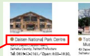
図表④ 外国語表記の媒体を作成する場合は、多言語表記対訳語集や地域の共通理解に沿った表記を使用

Daisen National Park Centre Daisen-Oki National Park Leaflet から抜粋