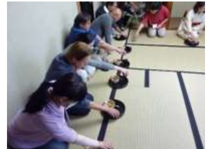
【茶道講師による文化講座】