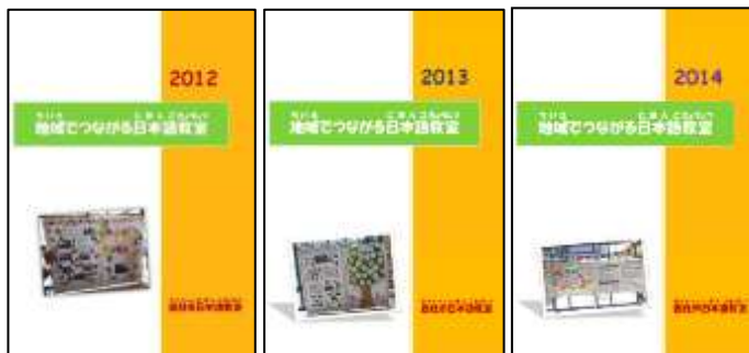
『地域でつながる日本語教室 2012～2014』

地域に暮らす外国人住民が、生活に必要な日本語の語彙・表現や日本の文化・習慣を学ぶとともに、地域生活に不可欠な行政情報・生活情報を得ることのできる学習教材を作成しました。継続的・自律的に日本語学習を行い、地域社会で安心した生活を送り、地域社会への積極的参加を促すことができるようにすることを目指しました。