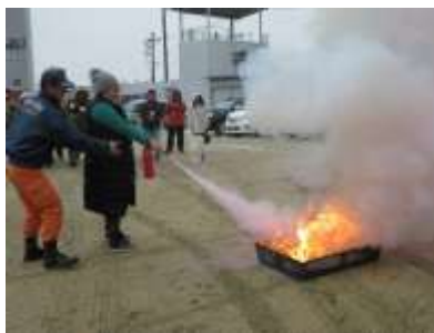
【消防署での消火訓練】