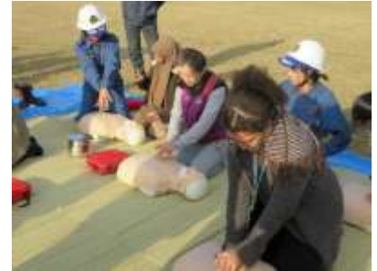
【防災訓練での救命訓練】