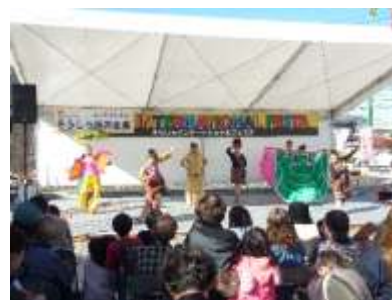
【国際フェスタの開催】