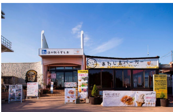
道の駅うずしおの外観

2019年4月からは、北海道鹿部町-しかべちょうに現地法人を設立し道の駅しかべ間歇泉公園の経営に参画。チームで赤字の道の駅を1年で黒字化し指定管理料の削減にも着手している。