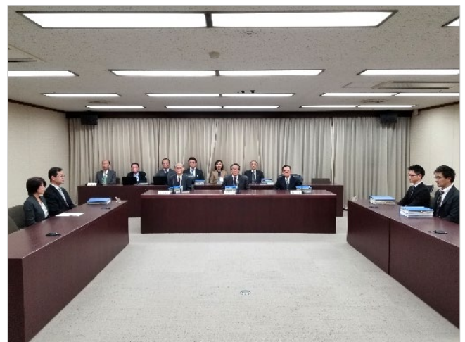
【審問期日の様子（イメージ）】

公調委は、裁定制度を含む公害紛争処理制度の適切な利用について、地方公共団体のみならず、国民、法曹関係者への周知・広報活動を進めており、令和においても引き続き、裁定制度は、公害紛争処理制度の中で重要な役割を果たしていくと考えられます。