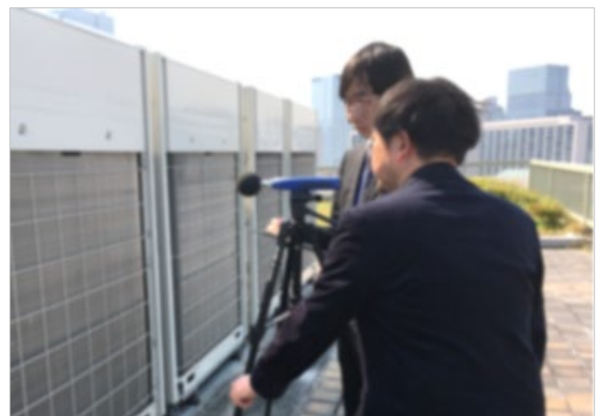
【測定の様子(イメージ)】

一方、事件によっては当事者の互譲によって円満に解決する方が望ましい場合もあります。