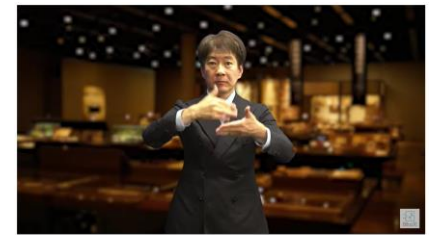
館内のバリアフリー化に向けた実証実験を実施