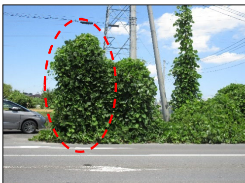
〈 改善前 〉