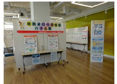
R2.10.12 尾道市役所でのパネル展