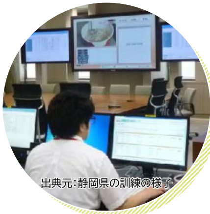
出典元: 静岡県の訓練の様子