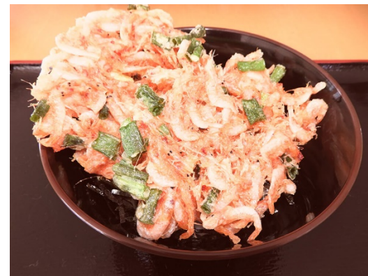
桜えびかき揚げ丼