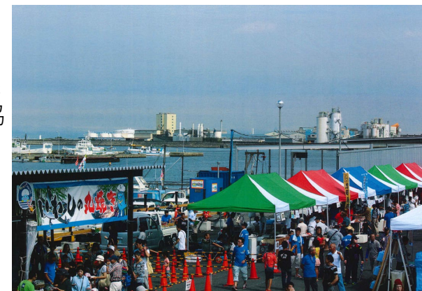
地蔵浜みなとマルシェの様子