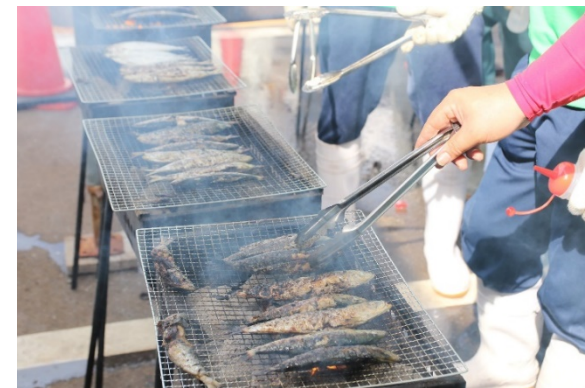
大漁親子まつりの様子