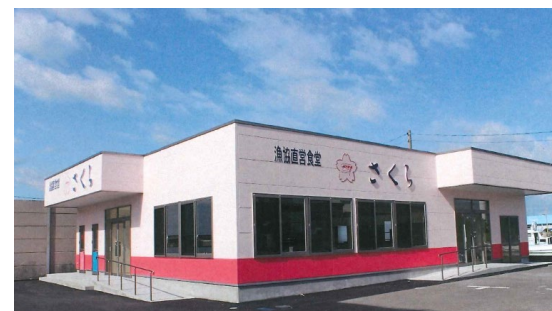
漁協直営食堂「さくら」