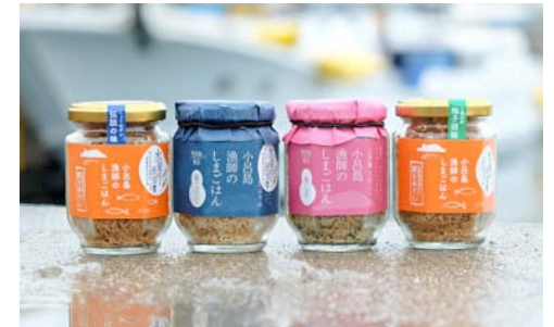
小呂島漁師のしまごはん