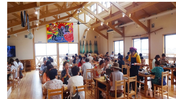
漁師食堂うのしま豊築丸