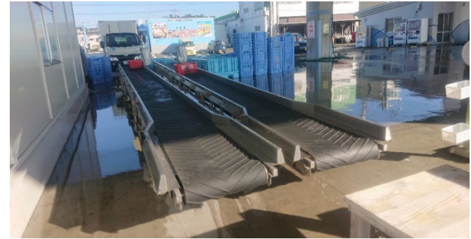
カゴを運搬するベルトコンベア