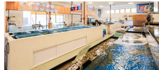
姫路とれとれ市場