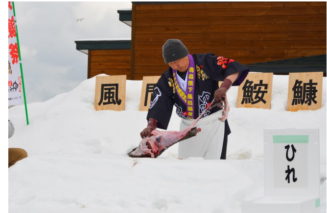
風間浦鮫鯨感謝祭の様子