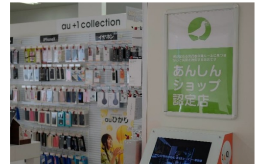
auショップ新宿西口