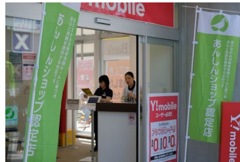
ソフトバンク練馬