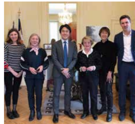
出張先のサン＝シール＝シュル＝ロワール市の皆さんと

平成 21年 4月 総務省採用 同 自治行政局選挙部選挙課 8月 鹿児島県総務部財政課 平成 23年 4月 厚生労働省社会・援護局障害保健福祉部障害福祉課 平成 25年 4月 総務省自治財政局調整課 平成 26年 4月 仙台市まちづくり政策局政策企画部プロジェクト推進課長 平成 28年 6月 地方公共団体金融機構経営企画部企画課調査役 兼 経営企画部リスク管理統括課調査役 兼 資金部資金課調査役 平成 30年 4月 総務省消防庁消防・救急課課長補佐 令和 元年 6月 現職