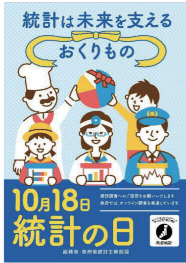
【令和5年度「統計の日」ポスター】