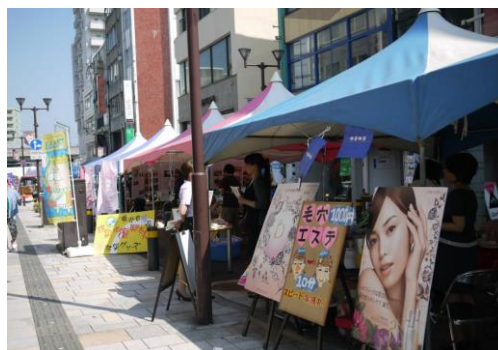
美のまちイベント開始前