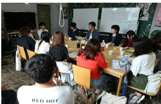
学生まちづくり班 例会

ノウハウとしまして、ソフト事業構築論、組織形成論、マネタイズ構築、地域活動特有の心の持ち方等を経験からフォロー、マネジメントをさせて頂いております。