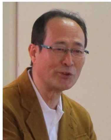
小学校の出前教室での兵藤委員