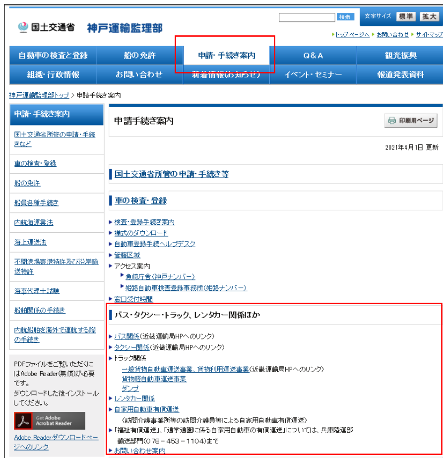
図2 神戸運輸監理部ホームページ（「申請手続き案内」ページ）