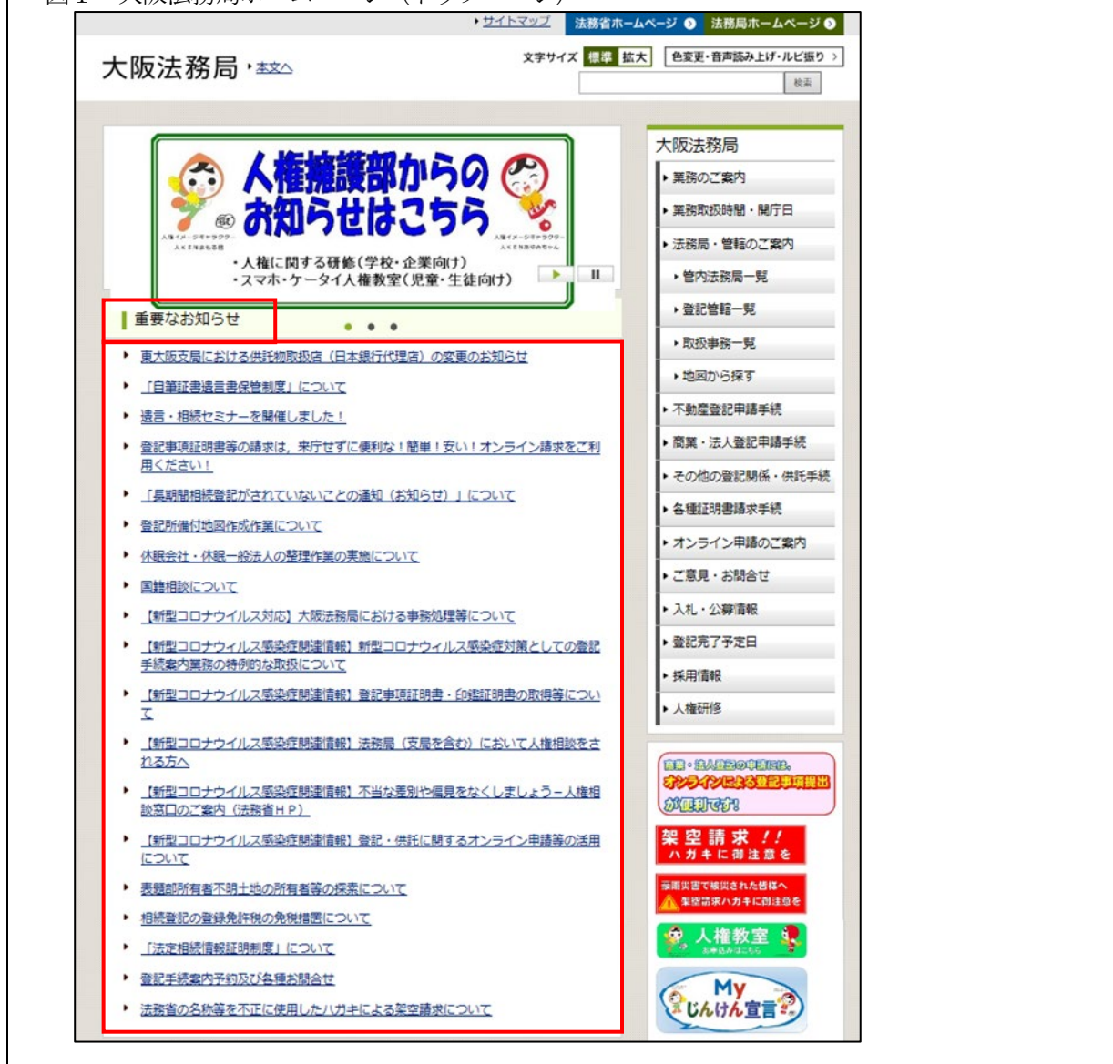
図1 大阪法務局ホームページ（トップページ）

「重要なお知らせ」の掲載情報は、様々な分野の情報が混在しているため、入手したい情報が分かりづらい状態となっている。また、情報の更新日の記載がないため、閲覧者にとって情報が時宜を得たものかどうか判断が難しい。