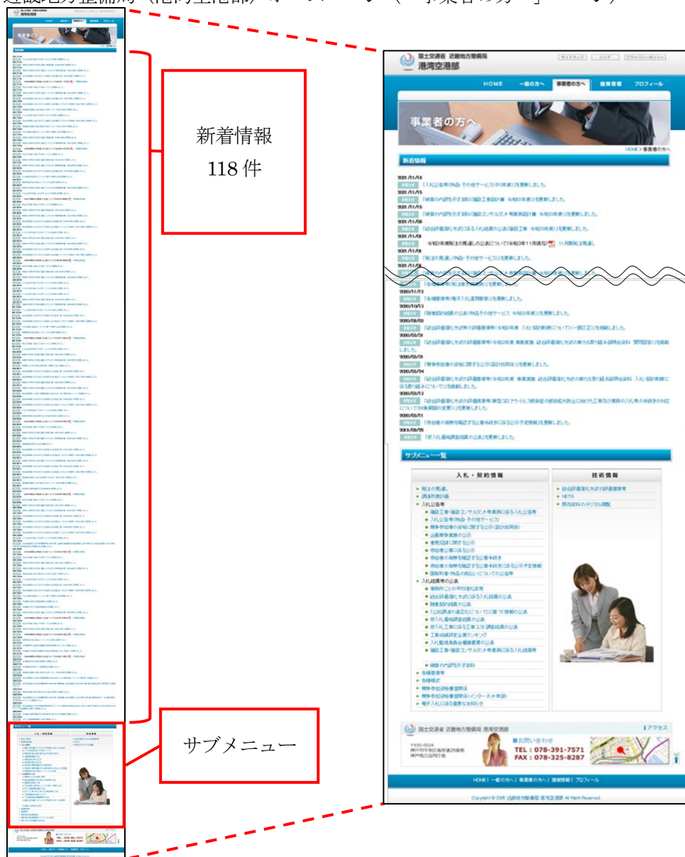
図1 近畿地方整備局（港湾空港部）ホームページ（「事業者の方へ」ページ）

近畿地方整備局（港湾空港部）のホームページでは、「事業者の方へ」ページに新着情報が118件（令和3年11月18日時点）掲載されているため、最下部のサブメニューまでたどり着くのに何度もスクロールする必要があり、利用者が必要な情報を見付けにくい状態となっている。