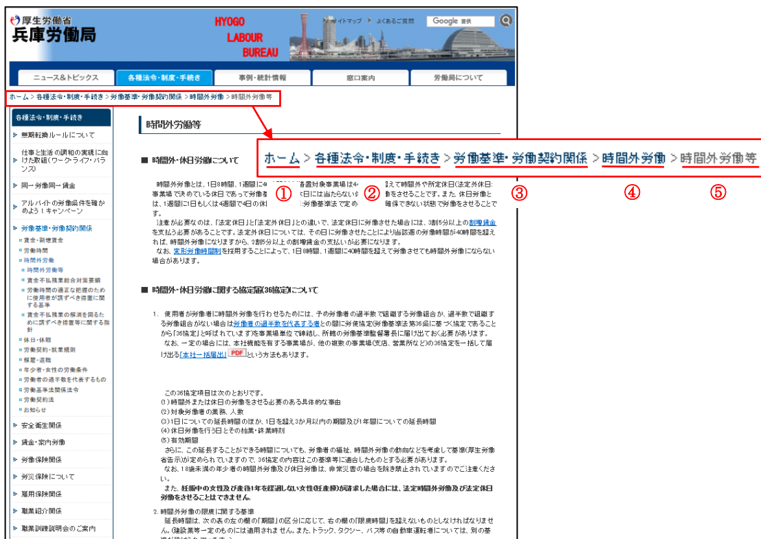
図1 兵庫労働局ホームページ（「時間外労働」ページ）

兵庫労働局のホームページでは、トップページとは形式が異なる旧ホームページにつながる（又は目的のページにたどり着くまでに旧ページを挟む）状況がみられ、図1の例のようにいくつかの階層を経なければ各コンテンツページにたどり着けない場合があり、目的の情報を探しにくい状態となっている。