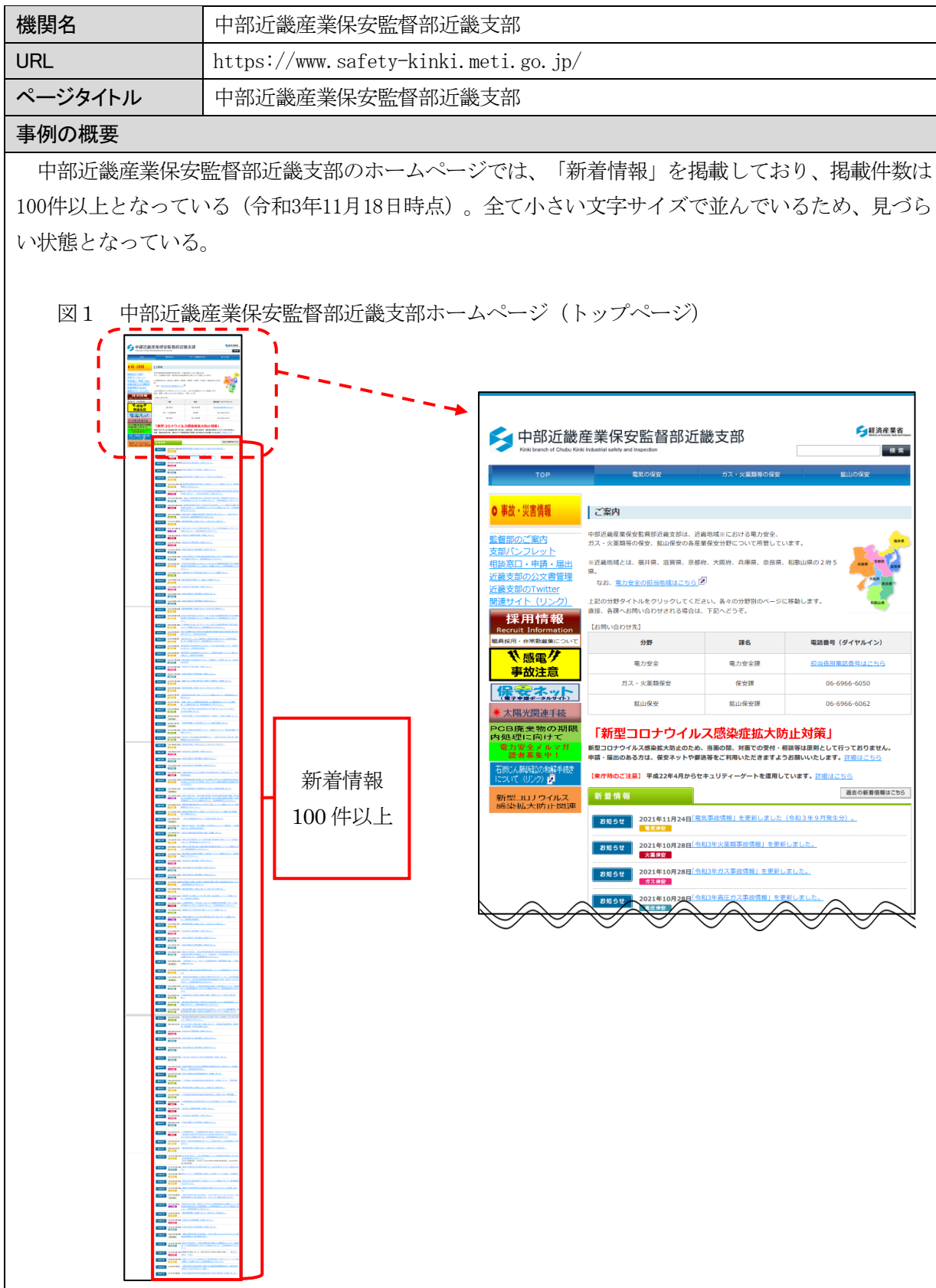
図表 2-(2)-③ 1つのページ内の掲載件数が多いとされた事例（その2）