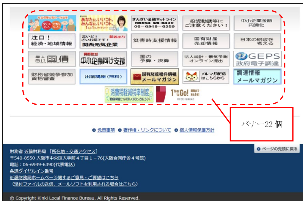
図1 近畿財務局ホームページ最下部（トップページ）

近畿財務局のホームページでは、最下部にバナー22個を掲載している（令和3年11月18日時点）。順不同でひとまとまりに配置されているため、目的の情報を探しにくい状態となっている。