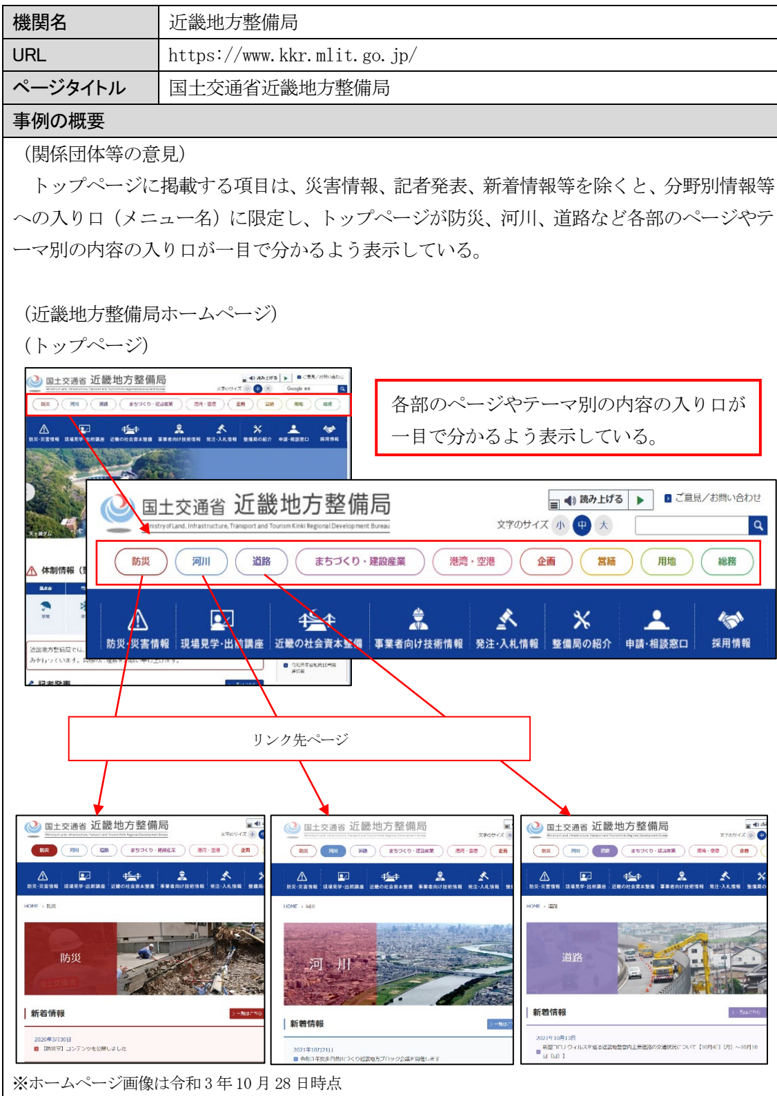
図表 2-(2)-⑫ 必要な情報を迅速に見付けられる構造にしている例