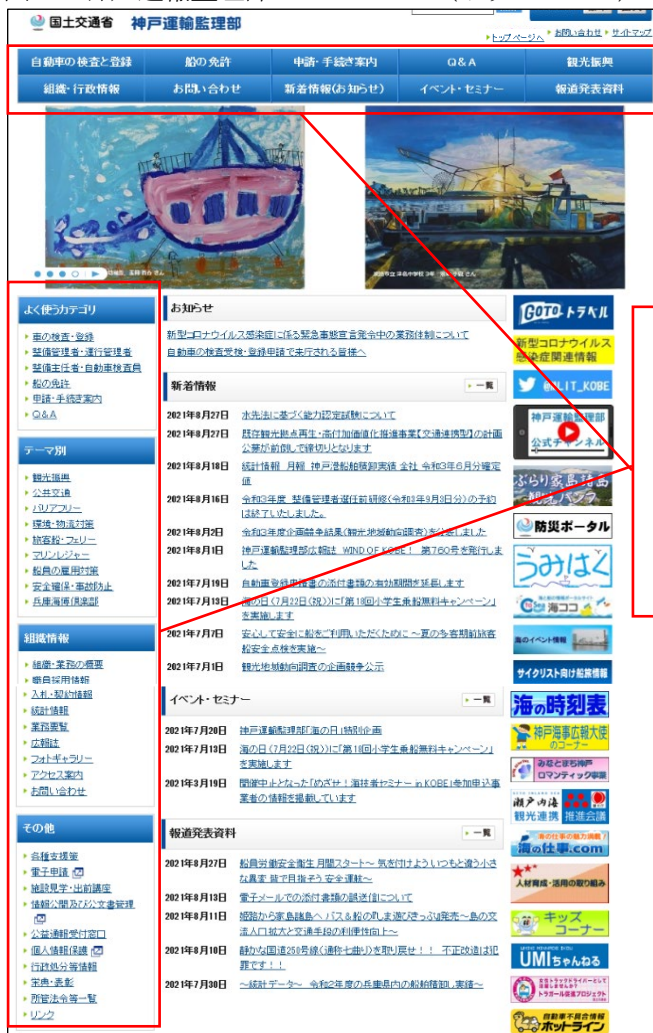
図1 神戸運輸監理部ホームページ（トップページ）