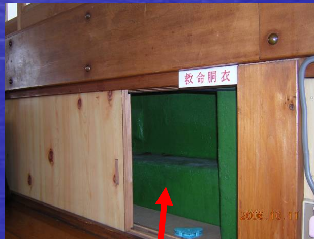
救命胴衣格納場所に救命胴衣未格納