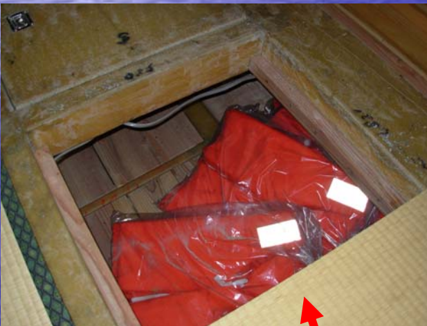
救命胴衣を畳の床下に格納