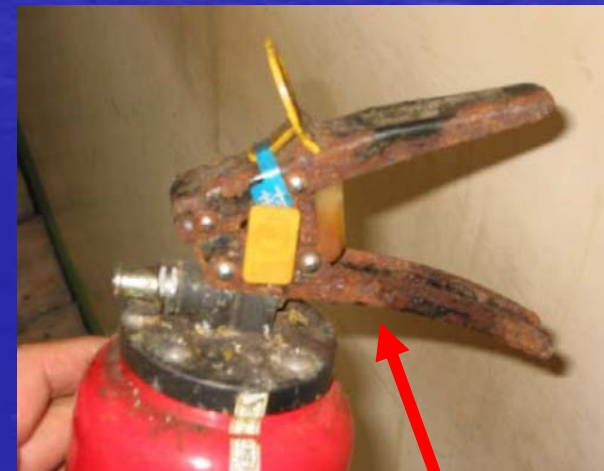
製造後約14年経過の小型船舶用粉末消火器、取手部分が錆びで腐食