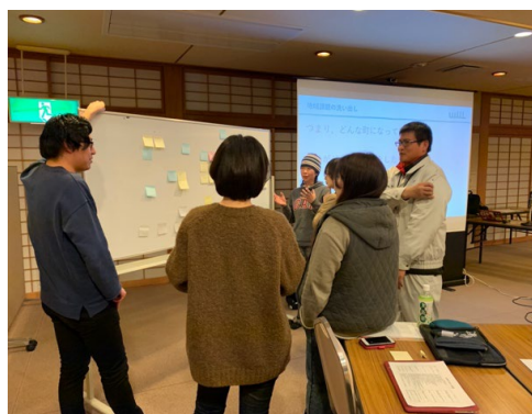
起業家支援の様子