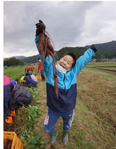
農泊・農業体験 (宮津市)