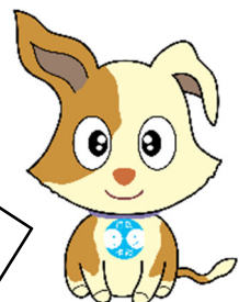
行政相談のマスコット キーン

総務大臣が委嘱した民間の有識者で、無報酬のボランティアとして、国民の皆さんから、国の行政活動全般に関する苦情などの相談を受け付け、助言や関係機関に対する改善の申入れなどを行っています。