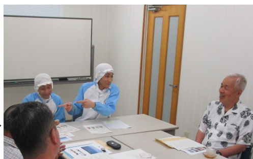
行政相談懇談会(民間企業事務室)