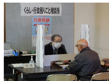
↑ 昨年度の相談所の様子