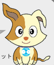
行政相談マスコット 「キクーン」

※相談方法や対応時間は、各相談窓口により異なります。詳しくは各相談窓口のホームページをご覧ください。