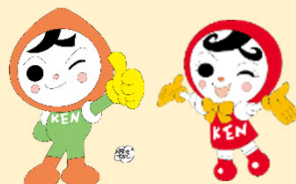
人KENまもる君 人KENあゆみちゃん 人権イメージキャラクター