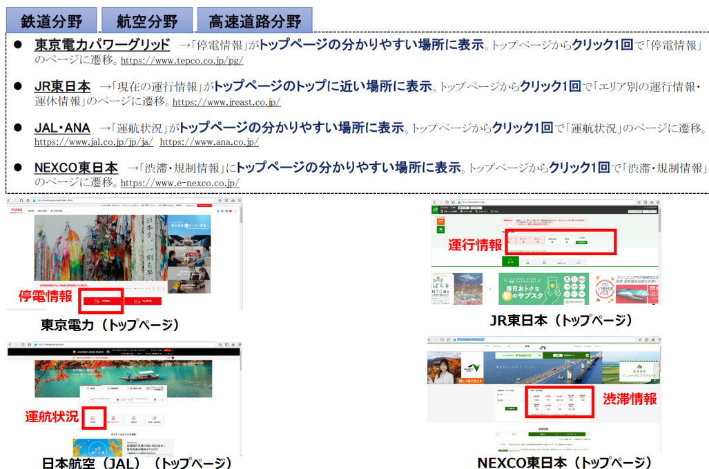
図2-8 トップページから障害関係情報に到達するまでの導線 14

掲載場所について、図2-8のとおり、電力会社等においては、平時より、停電情報をトップページの分かりやすい位置に配置し、緊急時においても当該箇所の情報更新を行う形としており、利用者にとってわかりやすい設計がなされている。他方、通信事業者の場合、通信障害情報の掲載場所が非常にわかりにくく、平時はトップページになく障害発生時のみトップページに掲載、平時からトップページにあっても目立たない記載など、必ずしも利用者にわかりやすいものとなっていない。