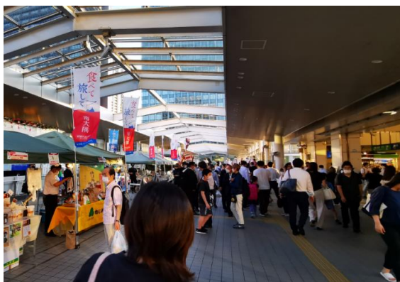
東京都品川区大崎駅前マルシェの様子

2021年から取り組んでいる鹿児島県南大隅町では、マルシェやSNSで町の情報発信を行い、これまでに1万人ほどの関係人口を創出しました。SNSやマルシェで特産品を購入された関心を持っていただいた方から、その後のEC購入や現地観光宿泊、移住者が生まれるなどの町のファン作りの支援を行っています。