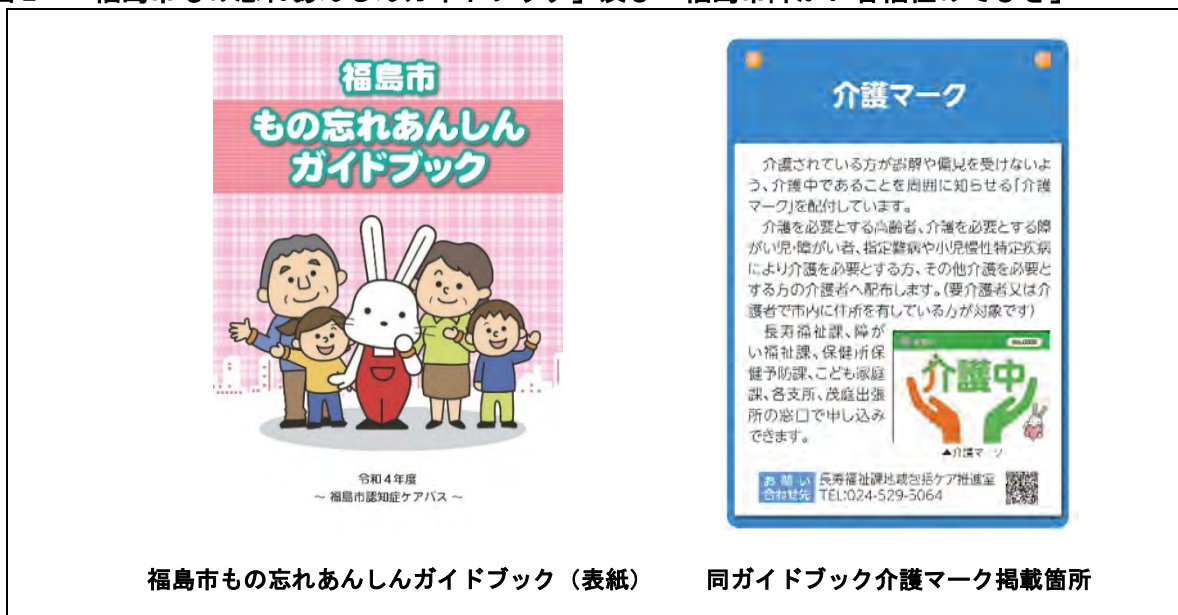
図2 「福島市もの忘れあんしんガイドブック」及び「福島市障がい者福祉のてびき」