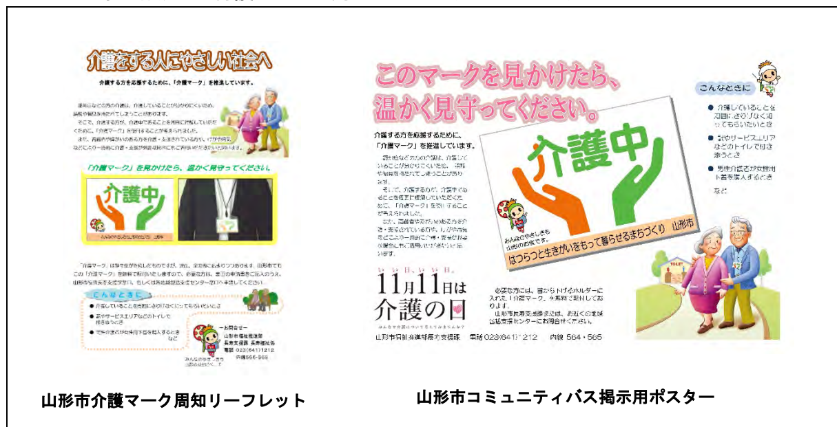
山形市介護マーク周知リーフレット