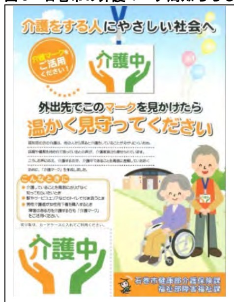
図3 石巻市の介護マーク周知ちらし