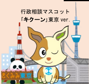
行政相談マスコット 「キクーン」東京 ver.

登記、税金、年金、道路など、生活の中の 様々な困りごとについて、専門家が相談を 受け付けます! ※相続などの法律相談も実施します!