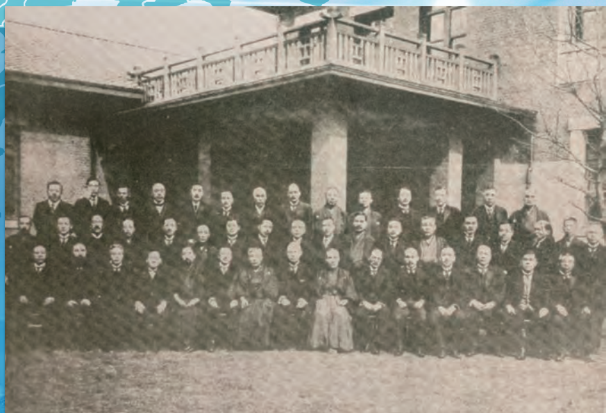
道府県会議長会創立総会記念撮影（於：大正12年3月17日 内務大臣官邸）