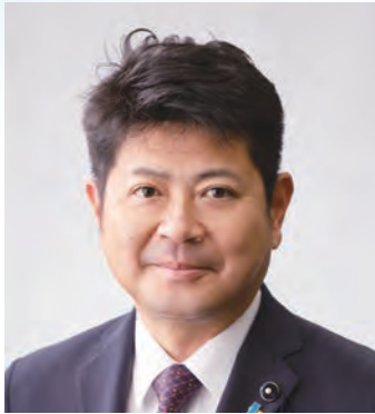
全国都道府県議会議長会会長 (富山県議会議長)